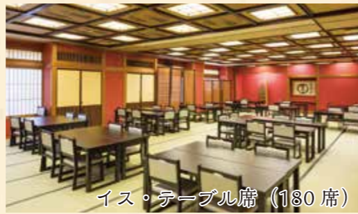
イス・テーブル席 (180席)